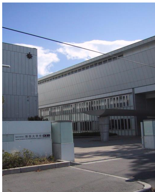
海技大学校 正門前

教育訓練は通信教育、座学及び乗船実習の3種類を効果的に組み合わせた方法で進められ、2年という短期間で三級海技士免許の取得と即戦力の養成をめざします。