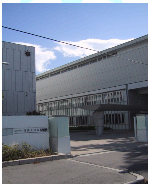
海技大学校 正門前

教育訓練は通信教育、座学及び乗船実習の3種類を効果的に組み合わせた方法で進められ、2年という短期間で三級海技士免許の取得と即戦力の養成をめざします。