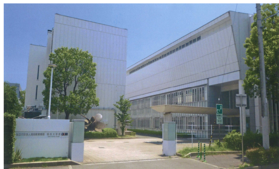
海技大学校 正門前

教育訓練は通信教育、座学及び乗船実習の3種類を効果的に組み合わせた方法で進められ、2年という短期間で三級海技士免許の取得と即戦力の養成をめざします。