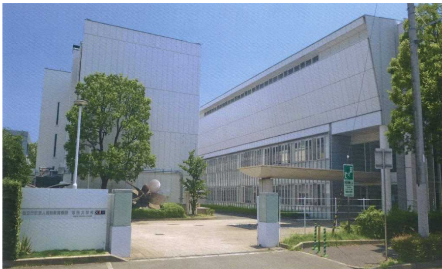
海技大学校 正門前

教育訓練は通信教育、座学及び乗船実習の3種類を効果的に組み合わせた方法で進められ、2年という短期間で三級海技士免許の取得と即戦力の養成をめざします。