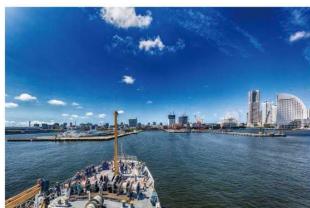
(カレンダー掲載写真の例)

お支払いは商品送付時に請求書を同梱しますので、銀行振込をお願い申し上げます。(振込手数料はご負担ください)