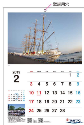
[カラーB4(見開きB3)版] 中綴じタイプ